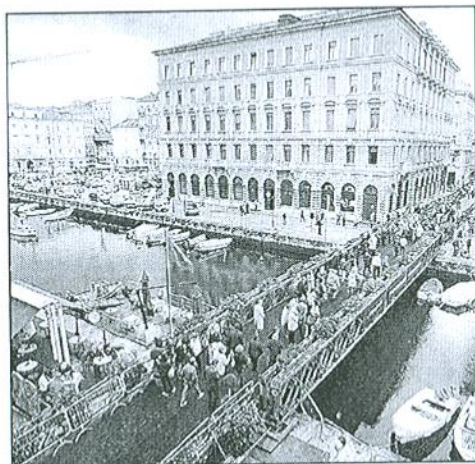
Il ponte Bailey il giorno dell'inaugurazione